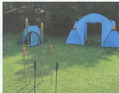
Man kann auch Zelten