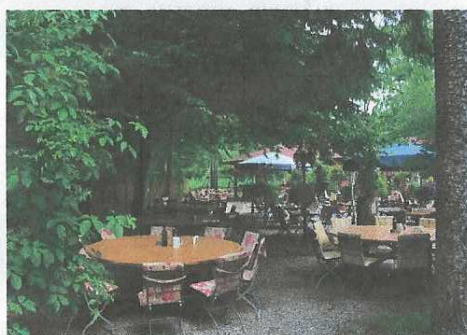
Das Gasthaus „Alte Liebe an der Amper“ mit Biergarten

In Mitterndorf bei Dachau, Im Lus 4 steht für unsere Münchner Sportvereine: FTM Blumenau von 1966 e.V. FTM Gern e.V. (gegr. 1907), FTM Nord e.V. FTM Schwabing von 1897 e.V. FTM Süd e.V. und FTM West e.V. ein großes Freizeitgelände in landschaftlich schöner Lage direkt an der Amper zur Verfügung. Hier befindet sich unser Jugendheim, das ursprünglich im Jahre 1957 von unseren Vereinsvorfahren mit eigenen Händen erbaut und 2004 durch einen Neubau ersetzt wurde, sowie die 1926 erbaute und von einem Pächter bewirtschaftete Gaststätte "Alte Liebe an der Amper".